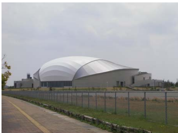
〈外観〉 ドーム型の県内初屋内50mプール