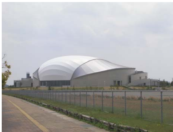
〈外観〉 ドーム型の県内初屋内50mプール